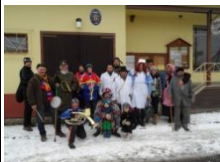
Maškary o masopustu

Pravidelně se tu koná neskutečná řada akcí, do jejichž organizace jsou zapojeni místní obyvatelé. Zpříjemní si tak své volné chvíle a zároveň se zaslouží o udržování tradic, někde už dávno zaniklých. A je vidět, že o návštěvnost není nouze. Zhlédněme pár příkladů: